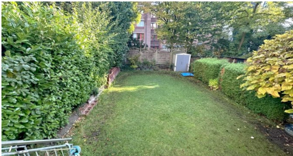
Garten im Spätsommer