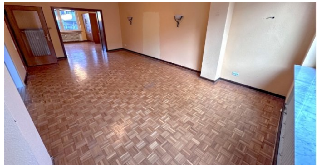
Wohnzimmer Blick Terrasse