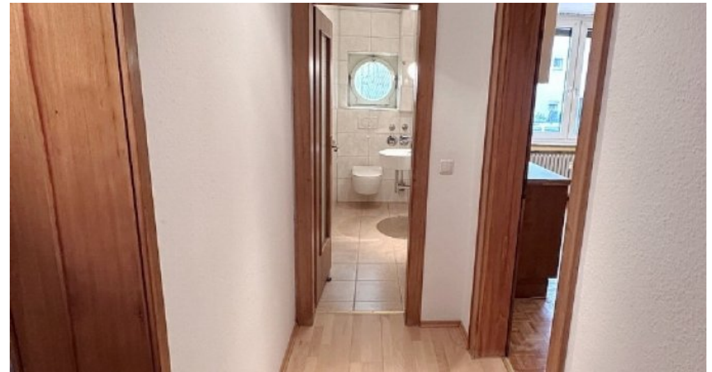
EG Blick WC