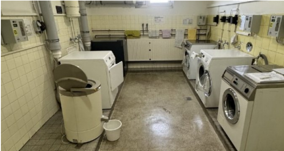
Wasch Trockenraum Speicher