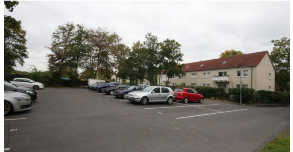
Stellplätze hinter dem Haus