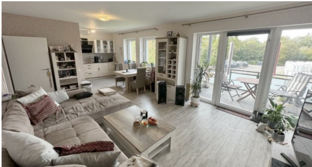
Wohnbereich Küche Balkon