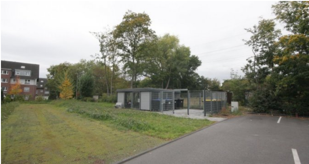
Abstellplatz für die Mülltonnen