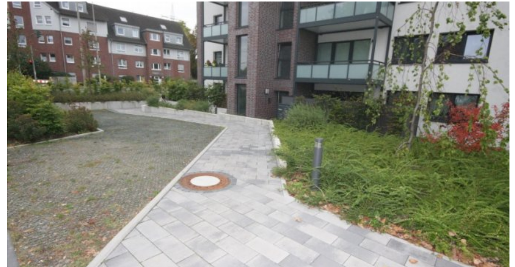
Zugang für Rollstuhlfahrer